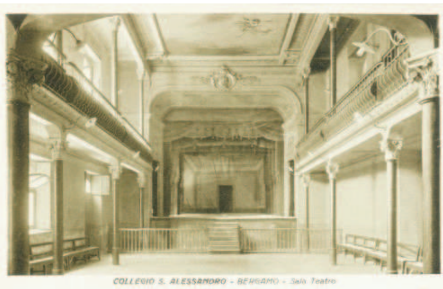
COLLEGIO S. ALESSANDRO - BERGAMO - Sala Teatro

Si diceva che l'esame di maturità lasciasse tracce indelebili per tutta la vita. Non so se per i giovani d'oggi accada altrettanto, ma è un fatto che i miei sonni sono stati diverse