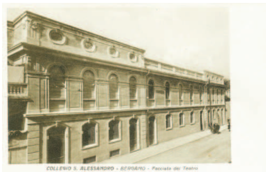
COLLEGIO S. ALESSANDRO - BERGAMO - Facciata del Teatro

Sarà che il numero 8 ha in sé il pregio di scatenare la contestazione giovanile, sarà pure l'effetto dei moti ottocenteschi di cui avevamo memoria storica, ma è un fatto che anche noi convittori cominciammo a sollevare la testa. In città i movimenti giovanili stavano prendendo piede, anche se il paragone con il successivo '68 sarebbe assolutamente fuori luogo. Bene o male, l'influsso della società autoritaria ed ultimamente di quella fascista esercitava ancora i suoi effetti. L'imprinting dell'infanzia era un marchio di fabbrica e ci vuole un'intera generazione perché si abbiano mutamenti sostanziali, però qualche cosa stava maturando anche fra noi. Certe