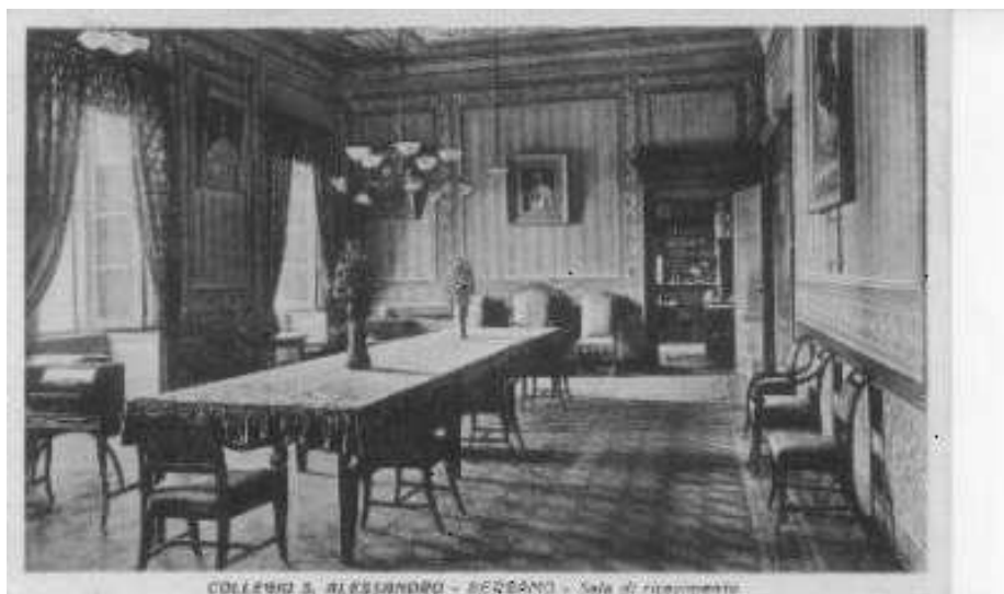
COLLEGIO S. ALESSANDRO - BRESCIA - Sala di ricevimento

Era comunque stimolante frequentare, una volta alla